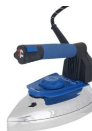
"NEW IRON PROF OPEN" (01027289)