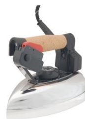
"NEW IRON PROF" (01027280)