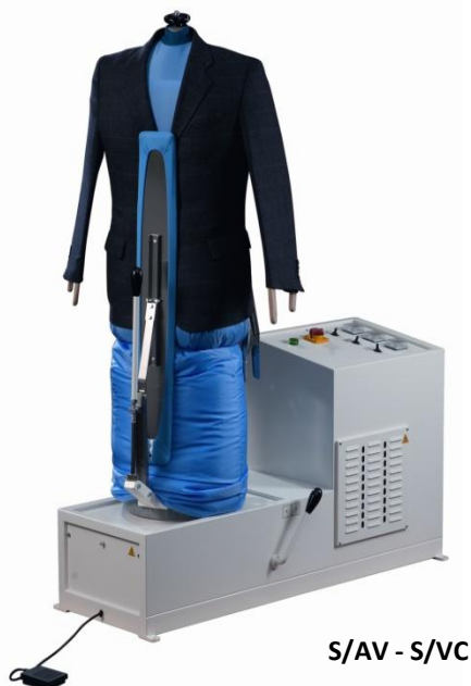
S/AV - S/VC