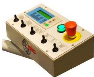
S/MSG Quadro comando Control panel Panel de commande