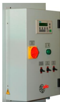
S/TP1-TE Quadro comando Control panel Panel de commande